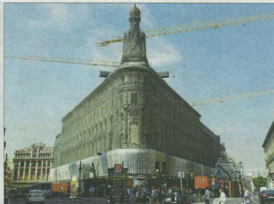
Obras en la manzana de Canalejas, en el barrio de Cortes, donde está prevista la apertura de un hotel.