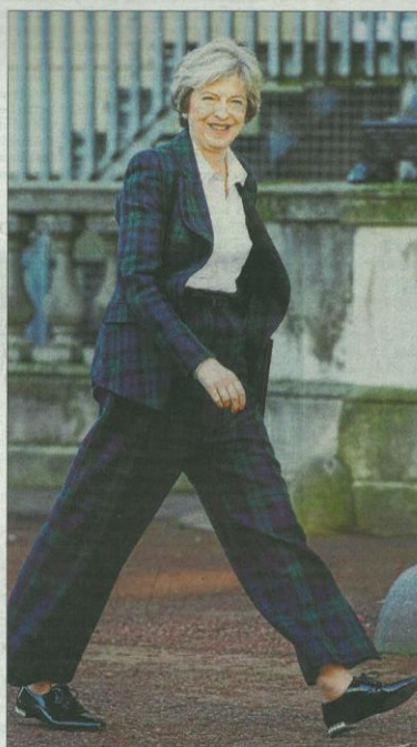
Theresa May, ayer, a su llegada a la Lancaster House de Londres.