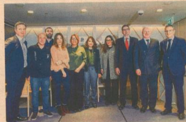
Un momento de la presentación de esta iniciativa, ayer en Madrid.

El desayunador VIP de NH Collection Eurobuilding se convertirá, con interiorismo de Nacho García de Vinuesa, en un restaurante pop up (temporal), que funcionará en horario de cena de martes a sábados y, en el caso del viernes, también de comida, en un comedor de 40 plazas. Se espera atender a unos 1.800 clientes en un mes. Cada chef ideará un menú degustación, a un precio de 90 euros (sin bebidas), con productos colombianos y locales. El precio se paga por adelantado al realizar la reserva correspondiente.